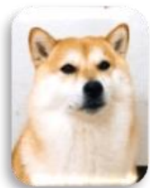
看板犬リボンちゃん