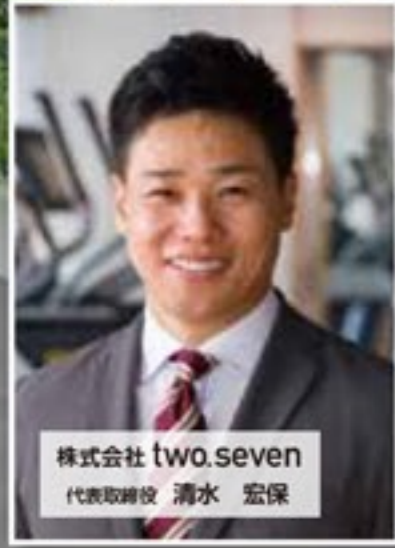
株式会社 two.seven 代表取締役 清水 宏保

長野オリンピック スピードスケート金メダリスト 清水宏保が運営するサービス付き高齢者向け住宅